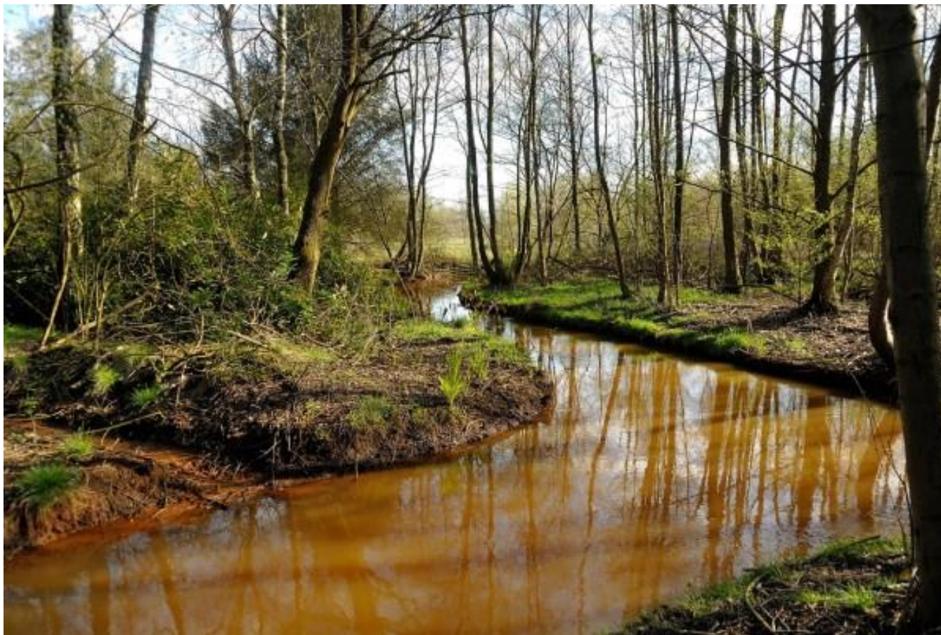
Het stuk dat we bezochten ligt aan een mooie meander van de Nete