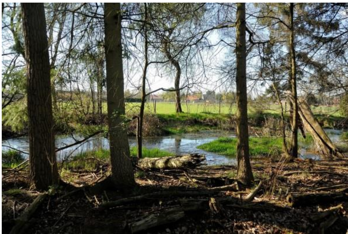
Deze poel ligt net op een aangrenzend perceel