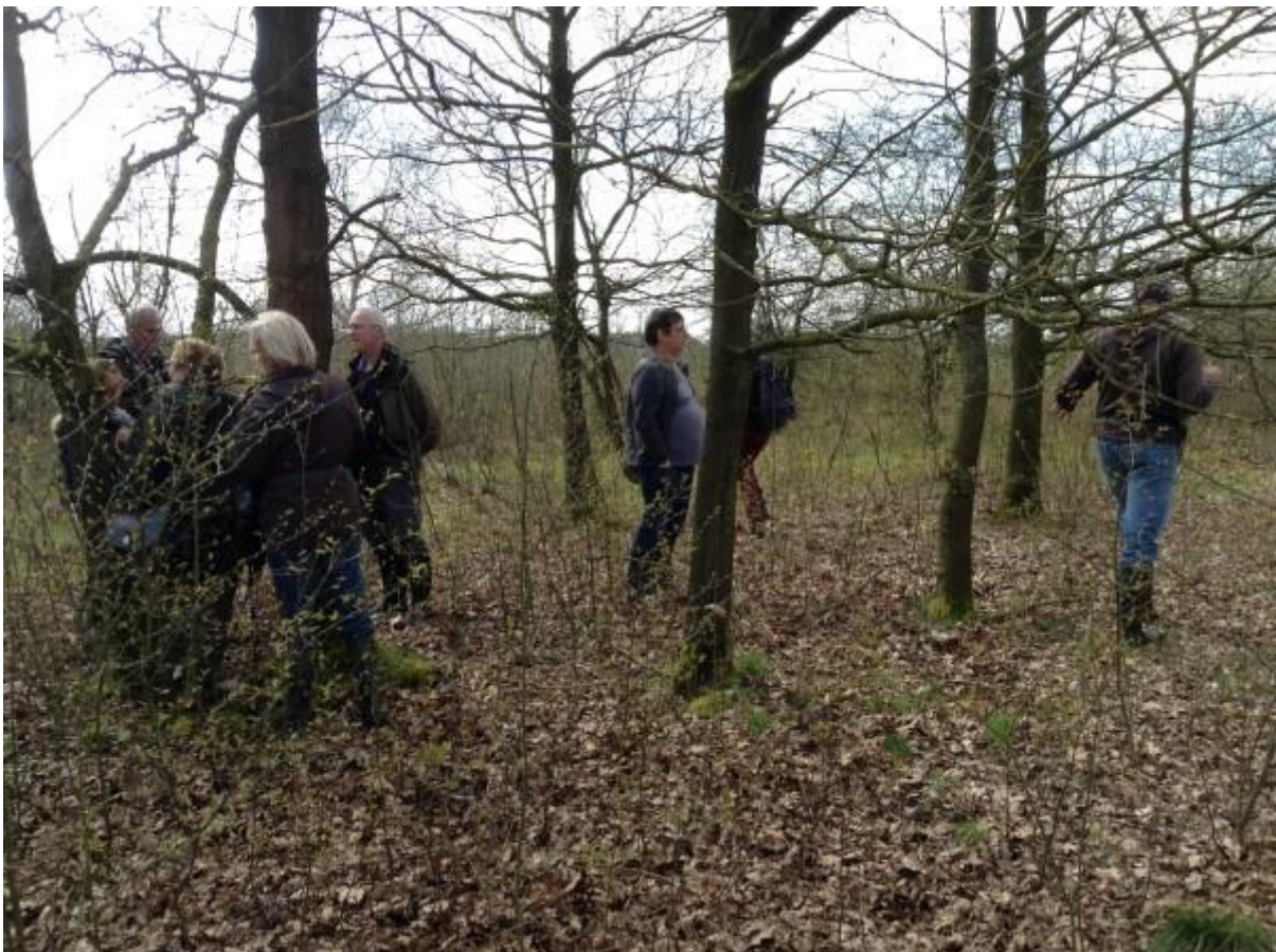
Bomen knuffelen was er ook weer bij