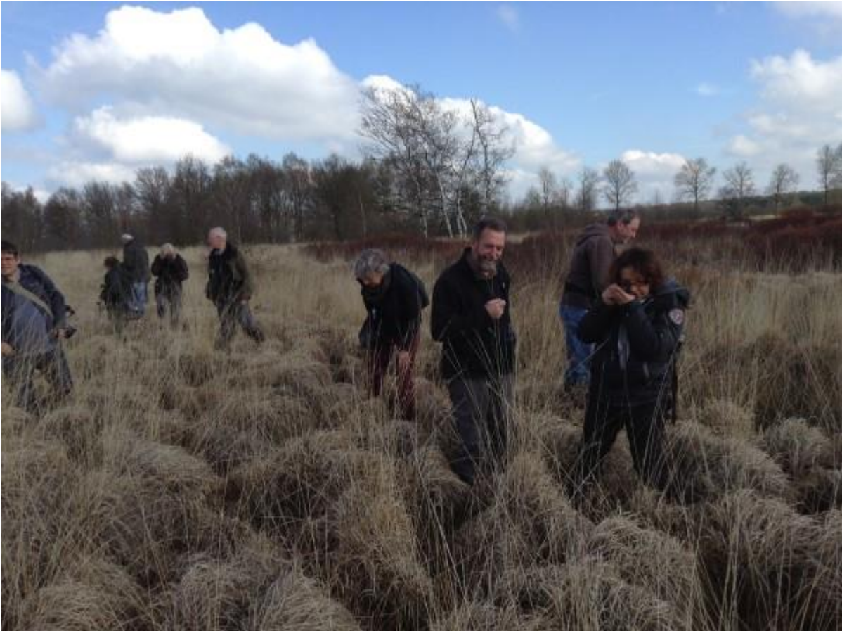
Op zondag 12 april hadden we de Antwerpse mossenwerkgroep op bezoek voor een mosseninventarisatie in de natte heide op Riebos Lommel en 't Plat in Overpelt.